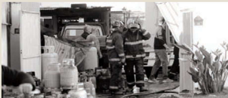
La competencia desleal perjudica a los empresarios que apuestan a la seguridad y la inversión.

Cadigas observa con preocupación una tendencia de crecimiento de la marginalidad en la distribución.