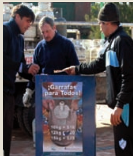
La deuda provocó un desfasaje en la economía de las empresas.